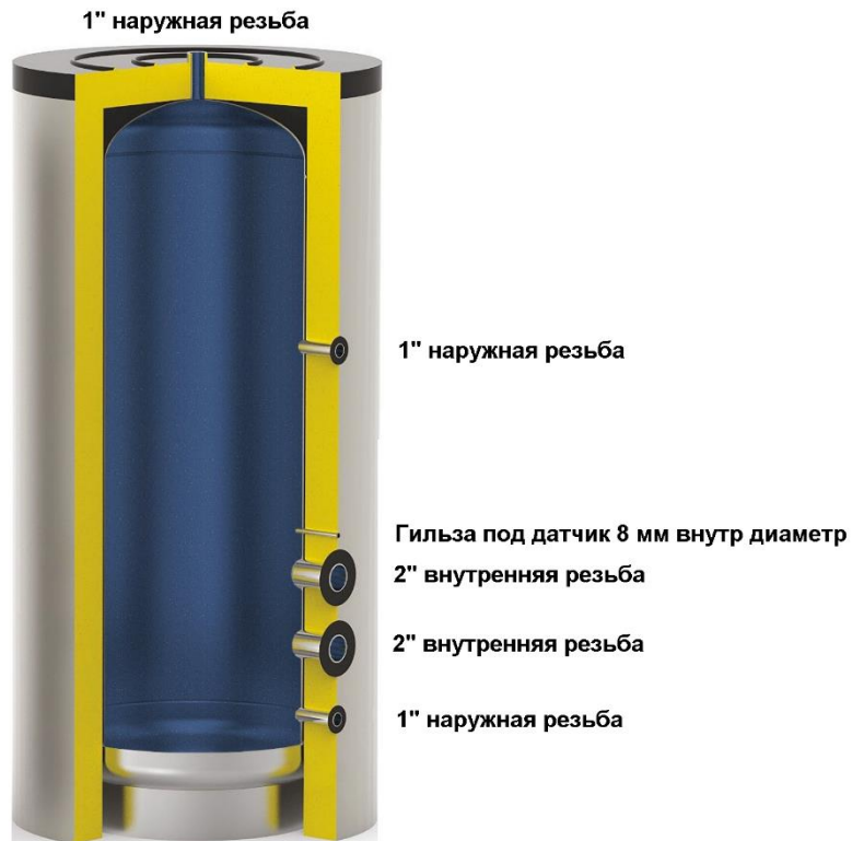
Схема бака серии АТР ELECTRO ЭМАЛЬ