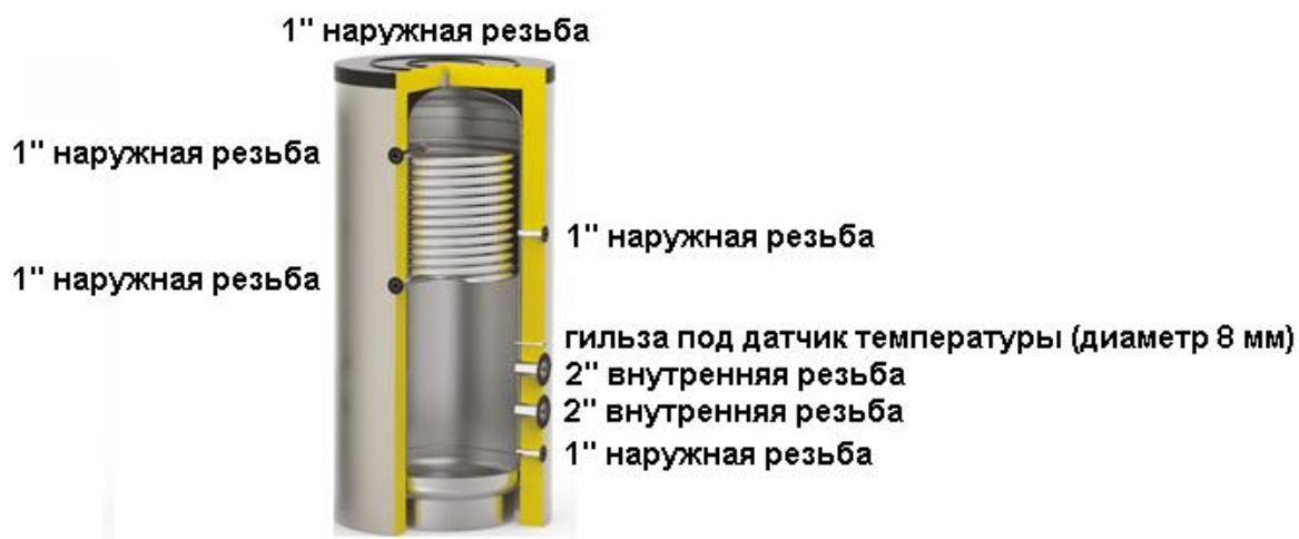
Схема бака серии SS Electro MONO