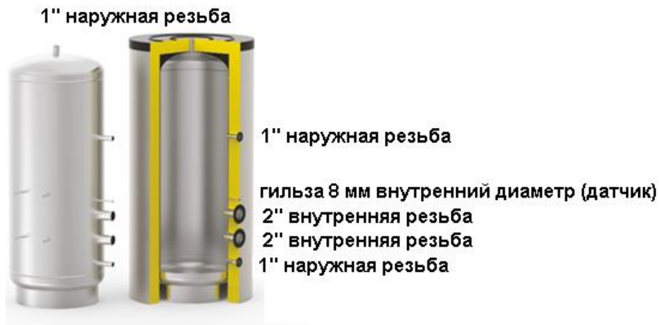
Схема бака серии SS ELECTRO