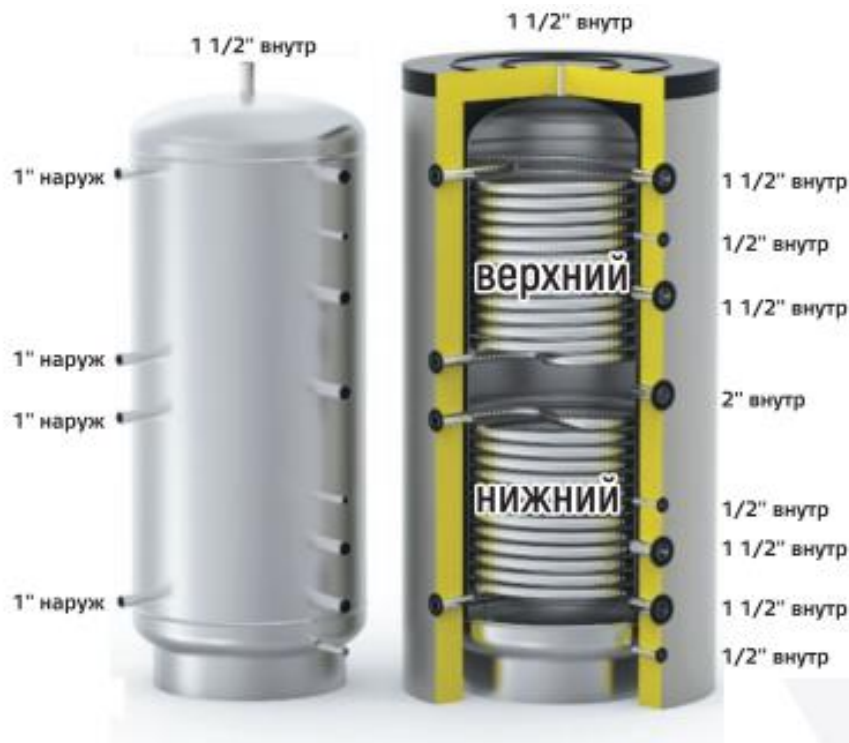
Схема бака серии HFWT DUO