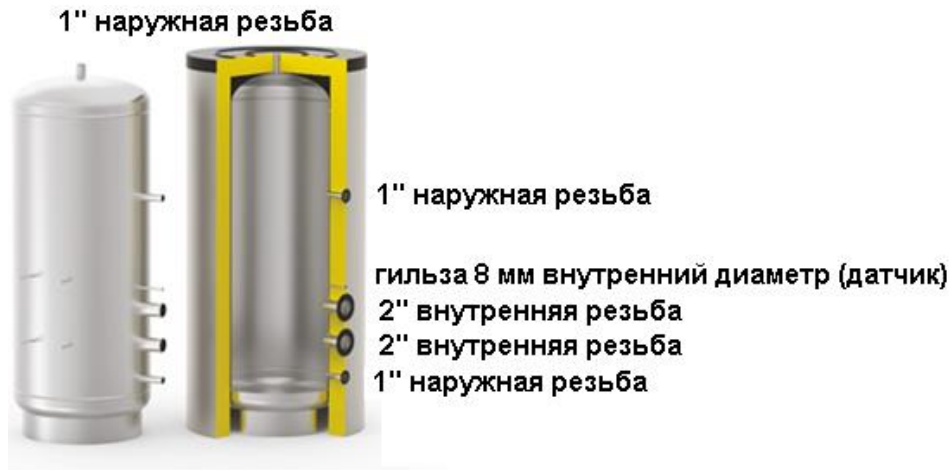
Схема бака серии AT ELECTRO